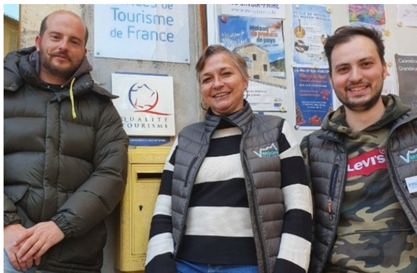
Verdon Tourisme nouvel ambassadeur de la marque Qualité

Cette voie, elle a été tracée en 2012 bien avant la promulgation de la loi Notre et le traité de fusion unissant les 6 anciens offices de tourisme. Elle consistait alors à leur modeste mise en réseau dont chacun devrait être aujourd'hui en mesure d'en apprécier le résultat.